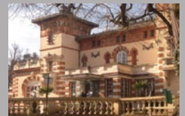
Accès restreint aux résidents

Traversé par le ruisseau du même nom, le domaine de Longues-Aygues est doté d'un magnifique parc de 6 hectares.